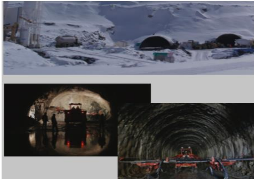
Şekil 4. Ovit Tüneli, Rize (İkizdere)-Erzurum (İspir) Arası

Şekil 3'te yer alan Erzurum-Bingöl-Diyarbakır arası bölünmüş yol çalışmalarının toplam uzunluğu 291,6 km olan bu yolda, 127 km tamamlanmıştır. Kalan 185 km'de çalışmalar devam etmektedir. Proje kapsamında 4 adet 234 m çift köprü bulunmaktadır (UDHB, 2014b).