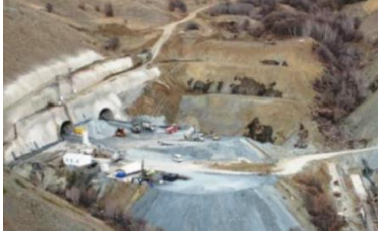
Şekil 5. Kop Tüneli, Erzurum-Bayburt Arası

Rize (İkizdere)-Erzurum (İspir) yolunda yer alan 2 x 14.015 m uzunluğundaki Ovit Tüneli'nin 2015 yılı sonunda açılması hedeflenmesine rağmen yapım çalışmaları sürmektedir. Standardı düşük ve yılın 6 ayı kar nedeniyle geçit vermeyen İkizdere-İspir Yolunda Ovit Tünelinin yapılması ile birlikte Kuzey-Güney koridorlarında en önemli akslardan biri olan 15. aksın yol standartları da yükseltilmiş olacaktır. Bu proje, Güneydoğu Anadolu Projesi (GAP) kapsamındaki illerin önce Doğu Karadeniz Bölgesine oradan da diğer komşu ülkelere yüksek standartlı bir yol ile bağlanması suretiyle GAP ürünlerinin önemli bir bölümünün Karadeniz limanlarına çıkarılarak Rusya, Ukrayna, Kafkaslar ve Türkiye Cumhuriyetlere ulaştırılmasında önemli bir potansiyele sahiptir (UDHB, 2014b).