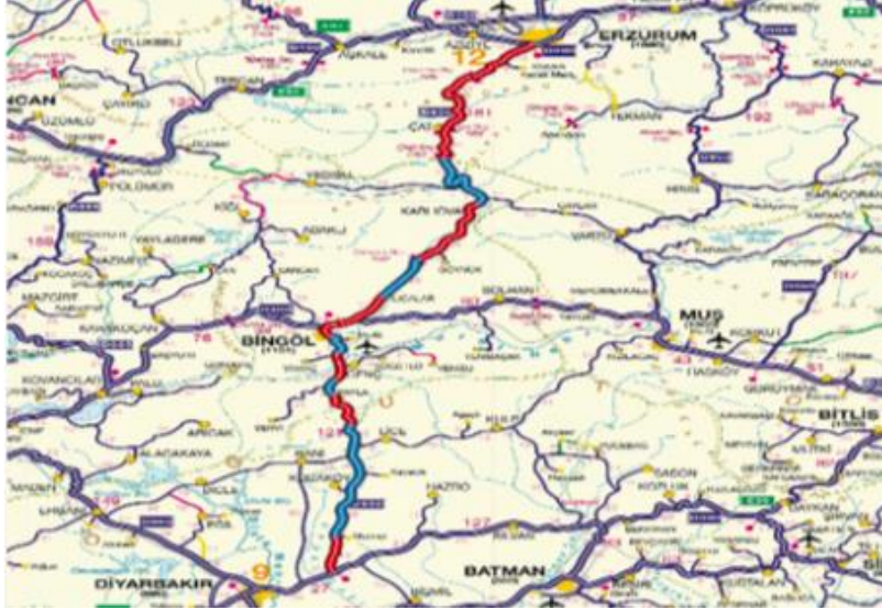
Şekil 3. Erzurum-Bingöl-Diyarbakır Arası Bölünmüş Yol Çalışmaları

Şekil 3'te yer alan Erzurum-Bingöl-Diyarbakır arası bölünmüş yol çalışmalarının toplam uzunluğu 291,6 km olan bu yolda, 127 km tamamlanmıştır. Kalan 185 km'de çalışmalar devam etmektedir. Proje kapsamında 4 adet 234 m çift köprü bulunmaktadır (UDHB, 2014b).