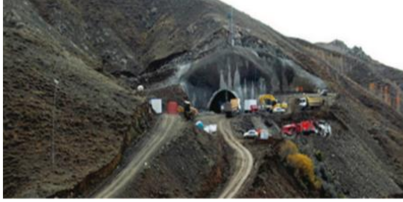
Şekil 6. Dallıkavak Tüneli, Erzurum-İspir Arası

hatlarıyla birlikte Bakü-Tiflis-Kars demiryolu projesiyle entegre edilmesi hedeflenmektedir (UDHB, 2014a).