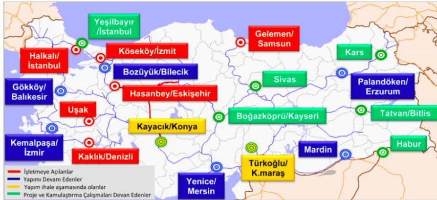
Şekil 2. Türkiye’deki Lojistik Merkezler

Lojistik merkezlerin, öncelikle organize sanayi bölgeleriyle bağlantılı olarak yük taşıma potansiyelinin yoğun olduğu İstanbul (Halkalı), Kocaeli (Köseköy), Eskişehir (Hasanbey), Balıkesir (Gökköy), Kayseri (Boğazköprü), Samsun (Gelemen), Denizli (Kaklık), Mersin (Yenice), Erzurum (Palandöken), Uşak, Konya (Kayacık), İstanbul (Yeşilbayır), Bilecik (Bozüyük), Kahramanmaraş (Türkoğlu), Mardin, Sivas, Kars, İzmir (Kemalpaşa), Şırnak (Habur) ve Bitlis (Tatvan) olmak üzere toplam 20 yerde inşa edilmesi planlanmıştır (Şekil 2).