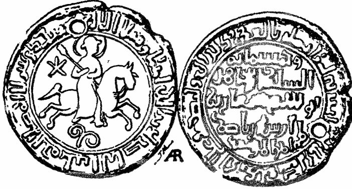
II. Leon'un sultan II. Süleymanşah adına bastırıldığı para