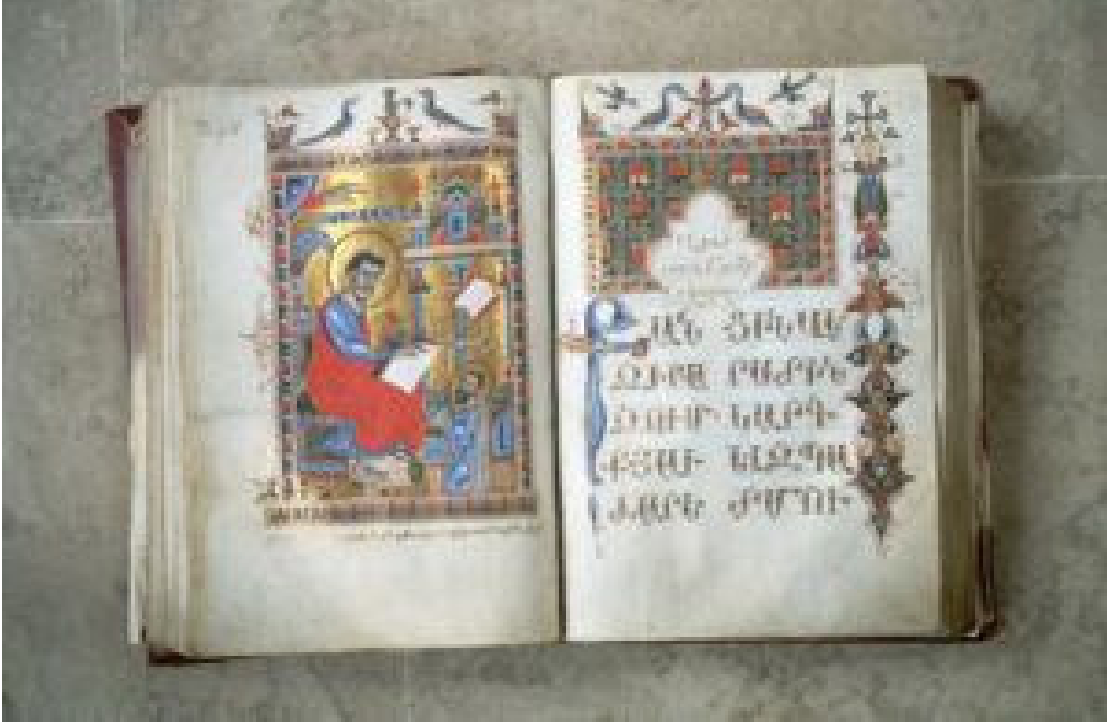
Ermenice Bir Dini Kitap